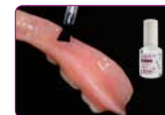
Applikáljon GC RELINE II Primer anyagot a felszínre, enyhén szárítsa meg levegővel