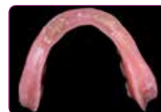
Az alábélelendő fogsor implantátum behelyezését követően

Egyszerű applikáció és kezelés az egész eljárás alatt