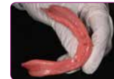
Az alábélelt fogsor