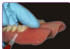
A szélek védelme a Reline II Finishing Material alkalmazásával