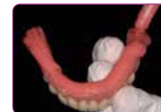
Applikálja GC RELINE II (Extra) Soft anyagot, a munkaidő 2 perc