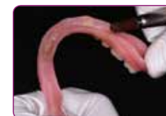
Tehertementítse az alábélelendő területet és érdesítse át a felszínt