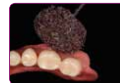
Finírozza a GC RELINE II WHEEL FOR FINISHING használatával