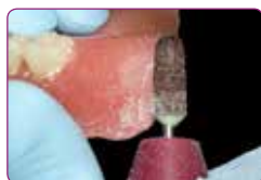
Kedvezőbben trimmelhető, így jobban kialakítható a széli zárása

Az első applikációt követő 3 hónapon belül hozzáadható anyag utólagosan ezzel követve a mucosa és a csont változásait. Az új GC RELINE II Remover for resin lehetővé teszi az alábélelés eltávolítását és gyors cseréjét.