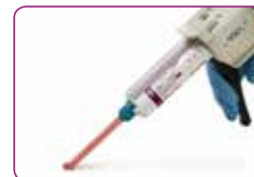
Könnyen használható patronos kiszerelés