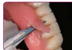
Távolítsa el a felesleget egy szike vagy olló segítségével, igazítsa a GC RELINE II POINT FOR TRIMMING használatával