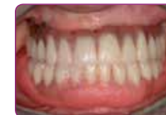
Helyezze a fogsort a szájba és funkcionálja, hagyja a szájban 5 percig